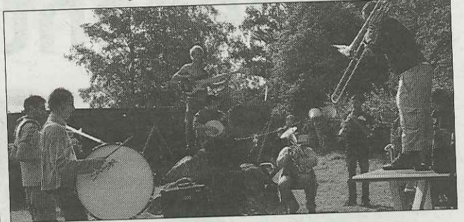
Le groupe en action.

Eléfanf'u est la fanfare festive itinérante de Dijon. Elle est composée d'une quinzaine de musiciens amateurs et professionnels aux univers musicaux variés. Créée en octobre 2007, cette dernière est une des composantes de Singallmusic, association existant depuis 1995 qui participe au développement et à l'enrichissement des pratiques musicales en milieu universitaire. Sur les traces de Singall Gospel Choir & Band, autre élément de Singallmusic, la fanfare Eléfanf'u explore un répertoire afro-américain basé sur le jazz New Orleans. Son succès est grandissant. De représentation sur le campus universitaire aux salles de concert