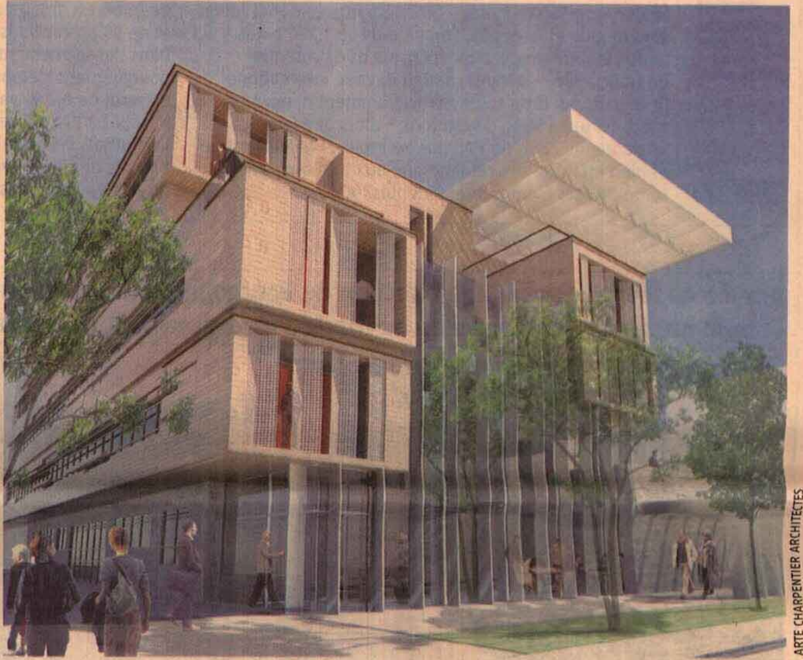
La maison de l'innovation, premier bâtiment qui sortira de terre, regroupera, sur 4.000 mètres carrés, 20 structures chargées d'accompagner les entreprises innovantes de Bourgogne.

Le chantier de construction de l'espace régional de l'innovation et de l'entrepreneuriat (Erie) a démarré, dans le quartier de Mirande à Dijon. Sur un site situé au croisement de la rocade Est et de la voie rapide Dijon-Quetigny, l'Erie sera composé de six bâtiments exemplaires sur le plan environnemental, soit 26.000 mètres carrés de bureaux et de laboratoires pour accueillir les structures chargées d'accompagner les entreprises innovantes, les plateformes de transfert de technologies et les start'ups. Projet emblématique porté par le conseil régional de Bourgogne, l'Erie va représenter un investissement global de 50 millions d'euros, dont la moitié sera prise en charge par le secteur privé. L'aménagement de l'ensemble, sous l'égide de la société d'économie mixte d'aménagement de l'agglomération dijonnaise (Semaad), sera signé du cabinet lyonnais d'architecture Mona Lisa.