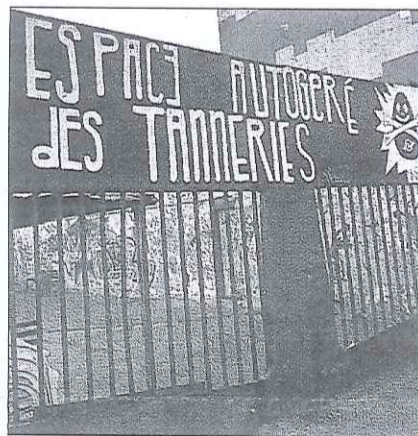
Les Tanneries conjuguent lieu de vie et d'expression artistique.

De son côté, l'espace autogéré a pris acte de cette proposition, mais réserve encore sa réponse. « Nous ne sommes